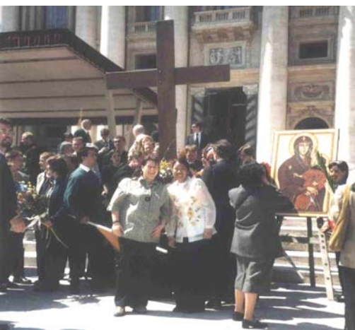
Nowy Aytin im Vatikan am Palmsonntag 2003 während der Übergabe des Weltjugendkreuzes an deutsche Jugendliche.

Das Glaubenszeichen ist der Vorbote der Weltjugendtage. Aus diesem Grund hat es am 4. April 2004 seinen „Pilgerweg der Versöhnung“ durch Deutschland in Berlin begonnen. Dort wurde es auch durch das